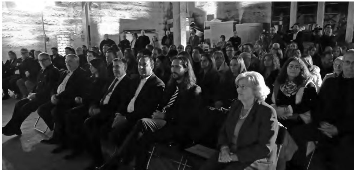
JUNTA DE FREGUESIA RECONHECEU “RESISTÊNCIA” DOS EMPRESÁRIOS

Presente na cerimónia, o presidente da Câmara Municipal de